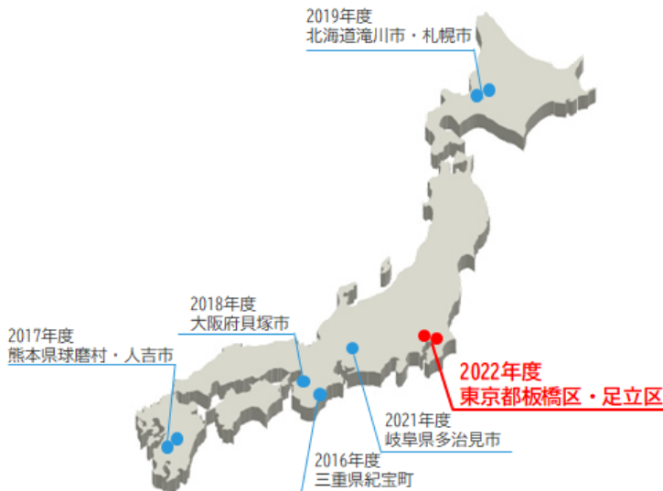
タイムライン防災・カンファレンス開催地